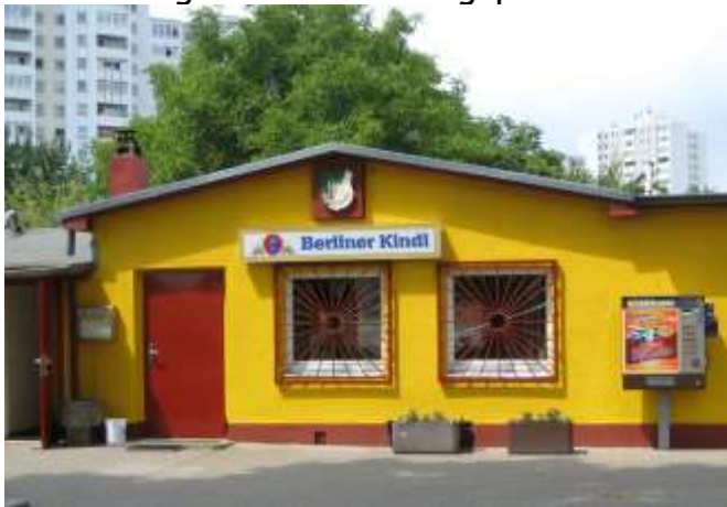
Kantine und Vereinsheim der Kolonie Freiheit

Mitte der achtziger Jahre war unsere Kolonie dann massiv vom Abriss bedroht, da der damalige Flächennutzungsplan uns nicht als